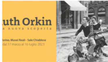
Ruth Orkin, una nuova scoperta Marzo 17, 2023 In "Eventi"