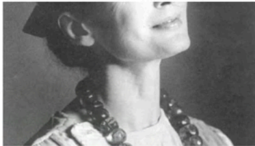
Carla Fracci, un ricordo VIVO Giugno 15, 2021 In "Spettacolo Vivo"