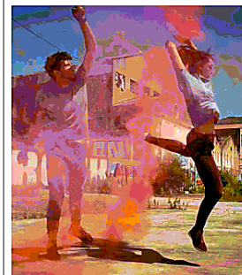
▲ La danza Dye Dye, Ertza (Spagna)

A partire dalle ore 18, negli spazi eclettici di via Baltea, centro d'incontro di un quartiere periferico di Torino nord, non molto frequentato dai torinesi, ma in cerca di un riscatto anche artistico, vedremo artisti all'apice di carriere coltivate fuori dai circuiti abituali. Spagnoli, perché il Focus di Interplay 2022 è sulla Spagna, e perché la Rete spagnola "A Cielo Abierto" riunisce la migliore danza urbana d'Europa, fatta di break dance.