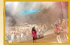
Si balla al ritmo di musica surf, raggaeton, happy

Si chiude stasera la tre giorni dedicata al Summer Games presso l'area ex galoppatoio con il Beach Boys Party, la reunion del Ciquiboom con gli staff di animazione della Riviera.