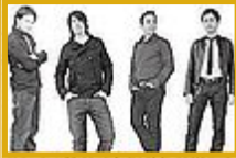
I 'TerzaCorsia' cover band dei Pink Floyd